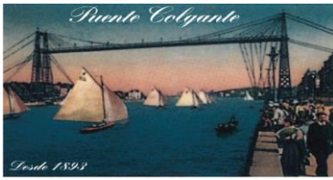
El Transbordador de Vizcaya

Hitzarmen hau Sektore Publikoko Kontratuen Legearen testu bateginak onesten duen 2017ko azaroaren 8ko 9/2017 Legearen aplikazio-eremutik kanpo dago, haren edukia kontuan hartuta. Izan ere, dekretu lege horren 6.2 artikuluan adierazten denez, lege horren aplikazio-eremutik kanpo geratuko dira sektore publikoko erakundeek zuzenbide pribatuaren peko pertsona fisiko zein edo juridikoekin egiten dituzten hitzarmenak, haien edukia ez badago sartuta lege honetan edo nahiz administrazio-arau berezietan araututako kontratuen edukien artean.