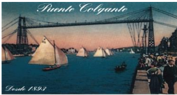
El Transbordador de Vizcaya

den jardueraren izaerarekin zalantzarik gabe bat etorri, behar-beharrezkoak izan, eta ezarritako epean egiten diren gastuak. Diru-laguntza jaso dezaketenez gastuen eskuraketa-balioa ezin da inola ere izan merkatuko balioa baino handiagoa.