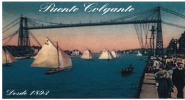
El Transbordador de Vizcaya