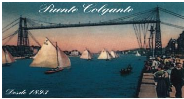
El Transbordador de Vizcaya