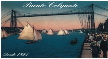
El Transbordador de Vizcaya

onuradunak ez duela betetzen aurreko paragrafoan ezarritakoa, hamar (10) eguneko epealdia emango zaio, bere egoera erregularizatzeko, eta adieraziko zaio, hori egin ezean, Aldundiaren diru-laguntza jasotzeko eskubidea kenduko zaiola, administrazio-ebazpen baten bitartez.